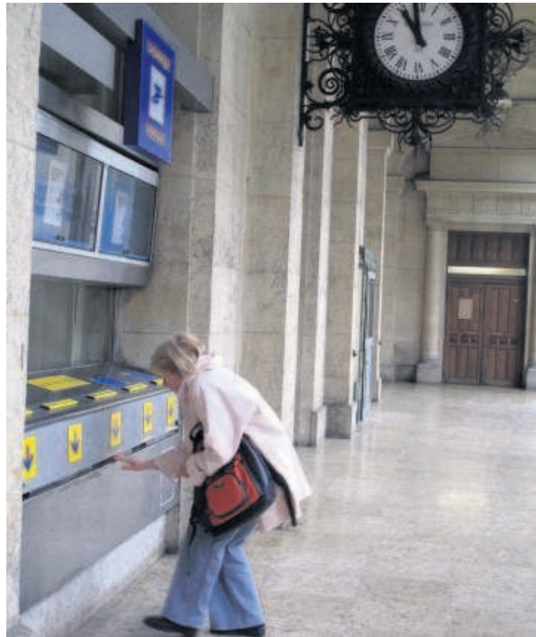
POSTE DU LOUVRE (1 er ). Selon des syndicalistes, la Poste envisagerait de vendre une partie du site inutilisée à des investisseurs privés. (LP/V. LAZARD.)

Les affirmations des syndicalistes sont totalement rejetées par la direction de la Poste. « Il y a un projet de réhabilitation du bâtiment. Mais nous démentons absolument toute intention de vendre, et tout départ d'activité. Nous allons même étendre notre présence postale, en créant sur le site du Louvre une plate-forme de distribution pour colis », assure une représentante de la Poste. Cette dernière affirme qu'une « réflexion est en cours avec la Ville de Paris » pour « implanter des services publics dans les espaces vacants ». Mais ce projet ne verrait pas le jour avant au moins trois ans. L'Hôtel de Ville confirme l'existence de négociations. « Les discussions débutent à peine. Le premier